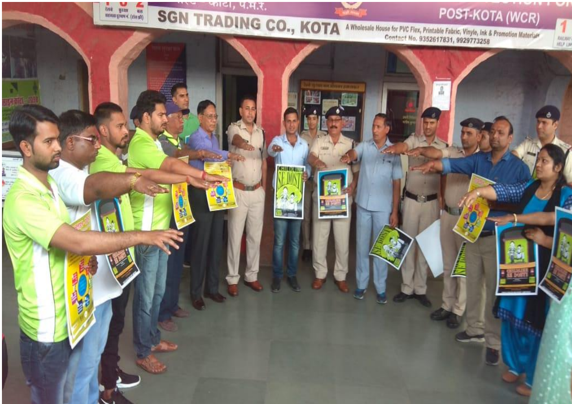
Celebrating the CSD week 2018-19 with the RPF Kota police

program was celebrated with the children of the government schools, with the children of the slum. In which the presentation of some cultural activities was given by the children. It was told by the child line team that what is the rights of children and how they can protect their rights.