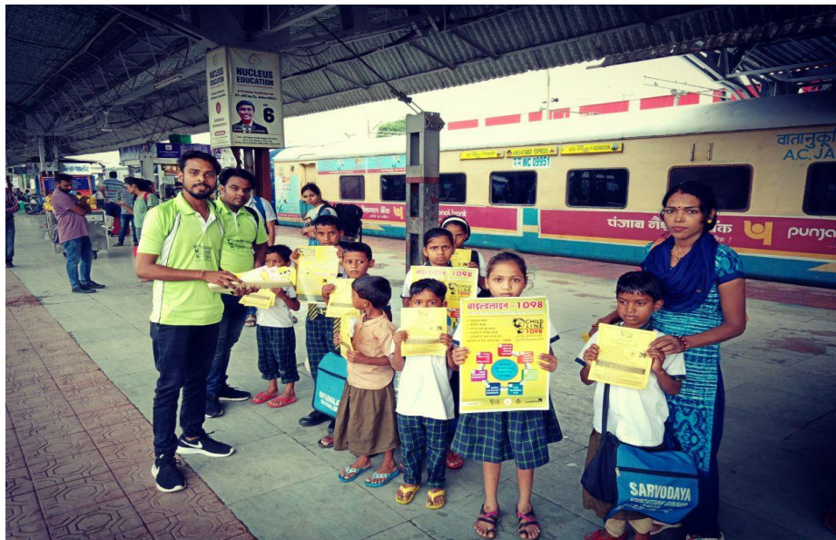
Child Line Awareness Program in Dalsa Legal Camp at Kota rural area.